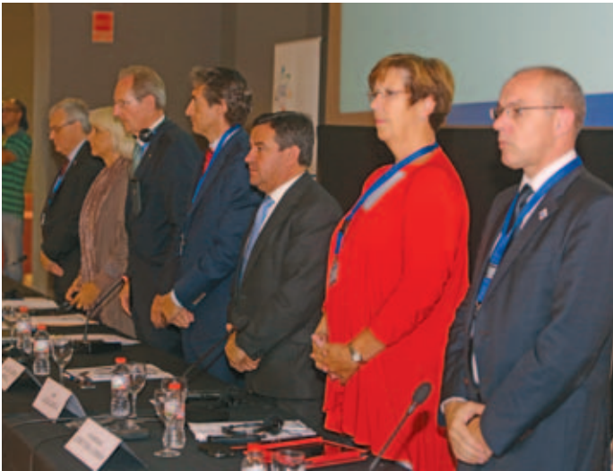
Autoridades del CMRE, la FEMP, el Ayuntamiento y la Diputación de Cádiz, en el Comité Director del CMRE.

biental, innovación tecnológica y modernización de infraestructuras, "sin olvidar su aportación en la lucha contra el paro" .