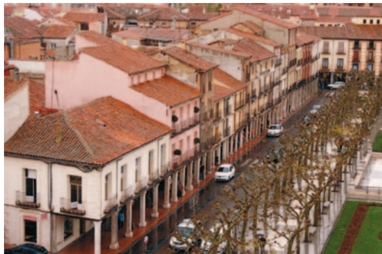
Los Ayuntamientos podrán gravar a través del IBI el patrimonio histórico artístico que esté afecto a actividades económicas.

De la Serna: "Somos la Administración más cercana al ciudadano y comprometerse con nuestra financiación es apostar por el bienestar social"