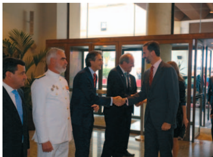
Llegada de los Príncipes de Asturias al Palacio de Congresos de Cádiz.

En este marco, "el CMRE continuará promoviendo una Europa coherente, tal y como querían sus fundadores; una Europa basada en los valores de la democracia, la unidad y la solidaridad" . Y así lo recoge en su Declaración, en la que además subraya que "esto exige el pleno respeto del principio de subsidiariedad, con Gobiernos Locales y Regionales empoderados, más que nunca, actores del cambio. Como las instituciones más cercanas a los ciudadanos, los Gobiernos Locales y Regionales tienen un impor-