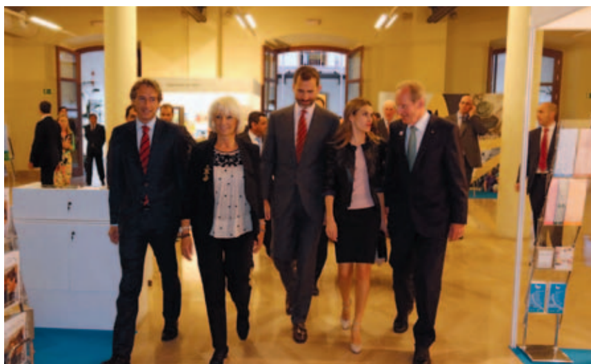
Los Príncipes de Asturias a su entrada en el Plenario junto al Presidente de la FEMP y la Alcaldesa de Cádiz (a la izquierda en la imagen) y al Presidente del CMRE (a la derecha).

En lo que respecta al desarrollo, la segunda de las "D", la Declaración de Cádiz señala que es necesario que los responsables económicos y políticos se preparen para el futuro: "Hacemos un llamamiento a favor de la acción concertada con el fin de poner en marcha políticas territoriales que favorezcan la innovación y la investigación" . Para los responsables locales presentes en Cádiz, el momento al que se enfrenta Europa requiere soluciones innovadoras a desafíos como el desempleo, el cambio demográfico, la diversidad social, los avances en tecnología y comunicación, el cambio climático, la movilidad o la creciente demanda de una energía limpia y segura. Y en este sentido, señalan, "estamos convencidos de que el desarrollo local y regional, impulsado por la movilización de todos los actores locales y regionales, en coherencia con las necesidades de los ciudadanos, es necesario para ayudar a Europa a salir de la crisis" .