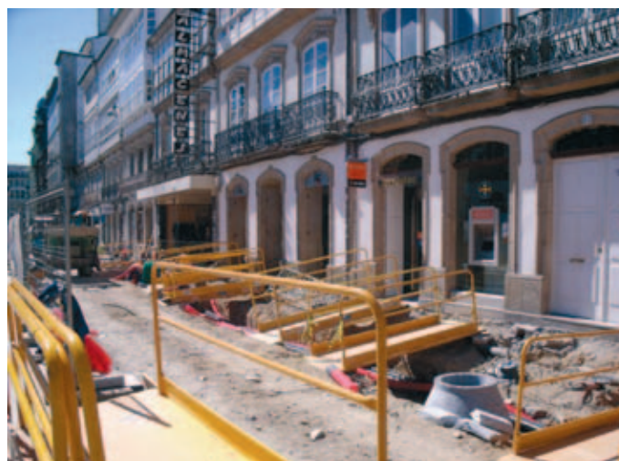
Obras en la Plaza de San Marcos de Lugo en febrero de 2011, una de las actuaciones premiadas.

En la categoría de pequeño comercio, el reconocimiento fue para la empresa familiar a Raza Nostra, ubicada en el Mercado de Chamarín de Madrid, por la progresiva evolución hacia la