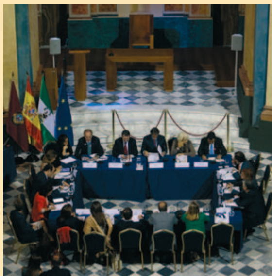
El Oratorio San Felipe Neri acogió la reunión de la Junta.