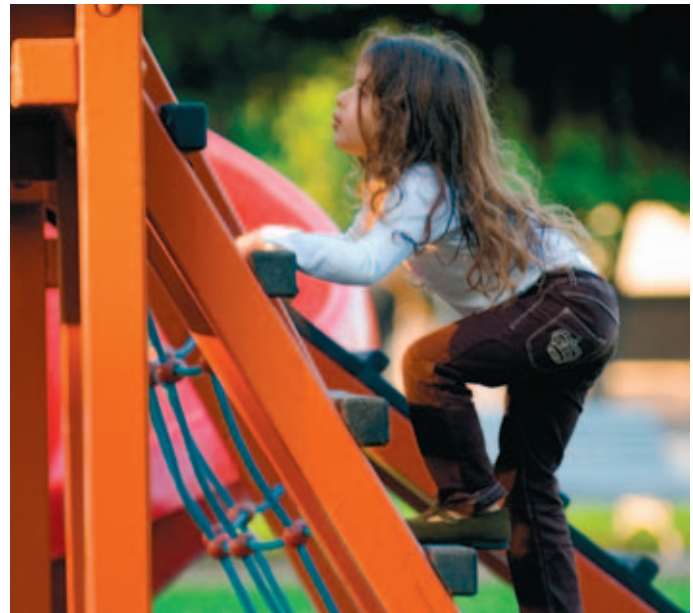
La Feria tiene en su programa la tercera edición del concurso de áreas de juegos y el premio AFAMOUR al diseño.

Una de las actividades estrella de ambos certámenes es la celebración de la tercera edición del Concurso de Áreas de Juegos Infantiles, una convocatoria que nació hace tres años con el fin de reconocer, apoyar y difundir el buen hacer de los municipios que invierten en zonas de ocio y que contribuyen al beneficio y bienestar de sus habitantes.