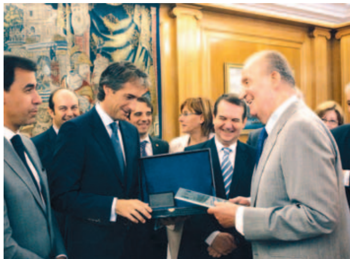
El Presidente de la FEMP entregó al Rey una pieza conmemorativa del Fuero de Brañosera.