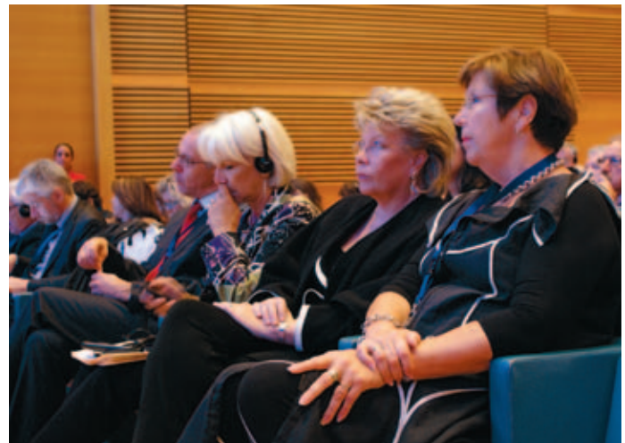
La Vicepresidenta de la Comisión Europea, Viviane Reding, minutos antes de su intervención, junto a la Alcaldesa anfitriona y la Copresidenta del CMRE, Annemarie Jorritsma.

Tras recordar la Constitución de Cádiz, "que nos introdujo por la senda de la modernidad y la libertad" , afirmó que la crisis económica, que afecta a todos, sitúa a las Entidades Locales españolas "ante el reto común de tratar de desplegar las medidas más innovadoras en la manera de hacer política y contribuir, desde nuestra posición, al crecimiento económico y la mejora del bienestar de nuestros ciudadanos" .