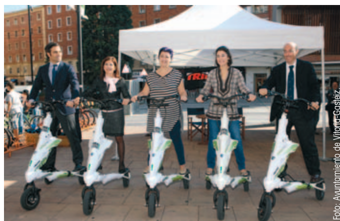
Participantes en el acto Vitoria-Gasteiz promovido por las instituciones europeas en España.

La jornada acogió también actividades tan originales como un desfile de moda en bici así como un partido de bike-polo, una