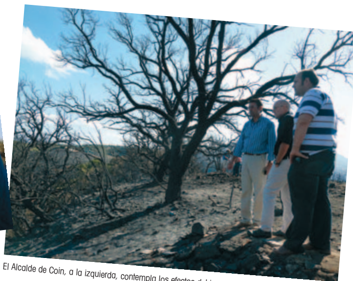
El Alcalde de Coín, a la izquierda, contempla los efectos del incendio con vecinos del municipio.