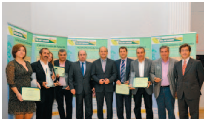
Los Ganadores de los concursos de Educación Ambiental y de Grupos de Voluntariado y II Concurso +Bio +Vida, posan tras la entrega de premios.

Nota de la redacción: la descripción de los proyectos premiados fue publicada en el número 249 de julio/agosto de Carta Local