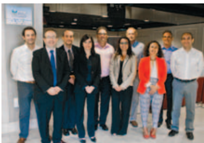
Miembros del jurado.

El acto de entrega de Premios se enmarca en un Encuentro en el que diversos ponentes –entre ellos Íñigo de la Serna, en su calidad de Presidente de la Red de Ciudades Inteligentes– ofrecerán sus puntos de vista sobre la creación de valor para las ciudades.