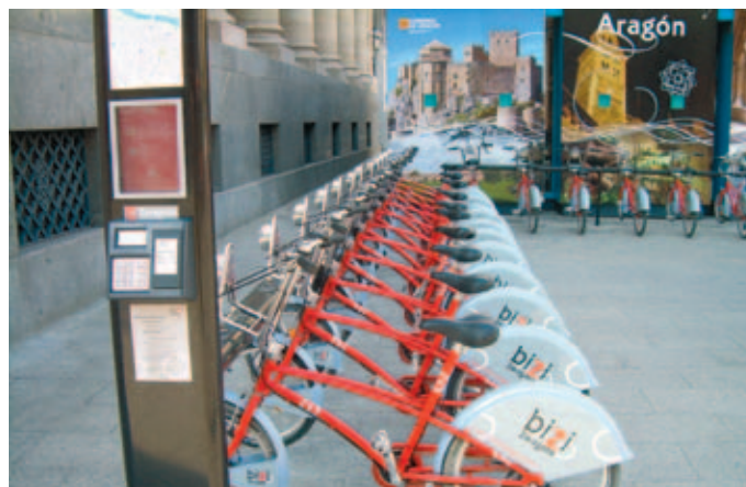
Parque de bicicletas de Zaragoza.

co realizado por la Red Española de Ciudades por el Clima sobre su grado de implantación, con datos relativos a 2010.