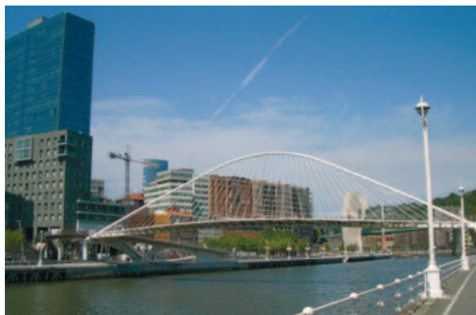
Bilbao ocupa, junto a Madrid, los primeros lugares del ránking.

El estudio pretendía conocer el impacto social y medioambiental de las principales ciudades españolas, incluyendo las 17 capitales autonómicas y las ocho ciudades más pobladas: Alicante, Barcelona, Bilbao, Córdoba, Coruña, Gijón, L'Hospitalet de Llobregat, Logroño, Madrid, Málaga, Mérida, Murcia, Oviedo, Palma de Mallorca, Las Palmas de Gran Canaria, Pamplona/Iruña, Santander, Santiago de Compostela, Sevilla, Toledo, Valladolid, Valencia, Vigo, Vitoria-Gasteiz y Zaragoza ★