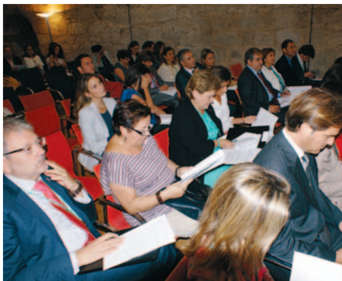
El Foro MICE reúne todos los años a profesionales de empresas del sector y a responsables locales en materia de turismo.

Esta reunión puso fin a dos días de debate en los que también se habló de las relaciones entre socios del SCB, de las políticas de responsabilidad social corporativa y las nuevas formas de atraer nuevos clientes. Sin olvidar las posibilidades que ofrece el marketing online y las redes sociales para la promoción de este segmento turístico, una cuestión que se aborda en las dos páginas siguientes en un artículo firmado por un participante en el III Foro MICE de Zamora ★