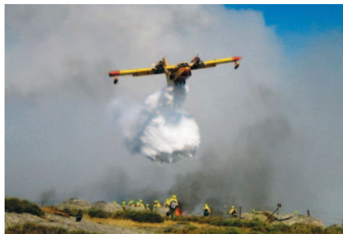
La coordinación de medios y Administraciones en la extinción de los incendios fue uno de los puntos destacados por el Ministro Arias Cañete.

Fernández Tapia (Coín) aboga por intensificar la vigilancia preventiva con personal en los puestos de vigilancia y realizar anualmente trabajos de limpieza de maleza y de cortafuegos, además de llevar a cabo clareos de la masa forestal. Otra de las accio-