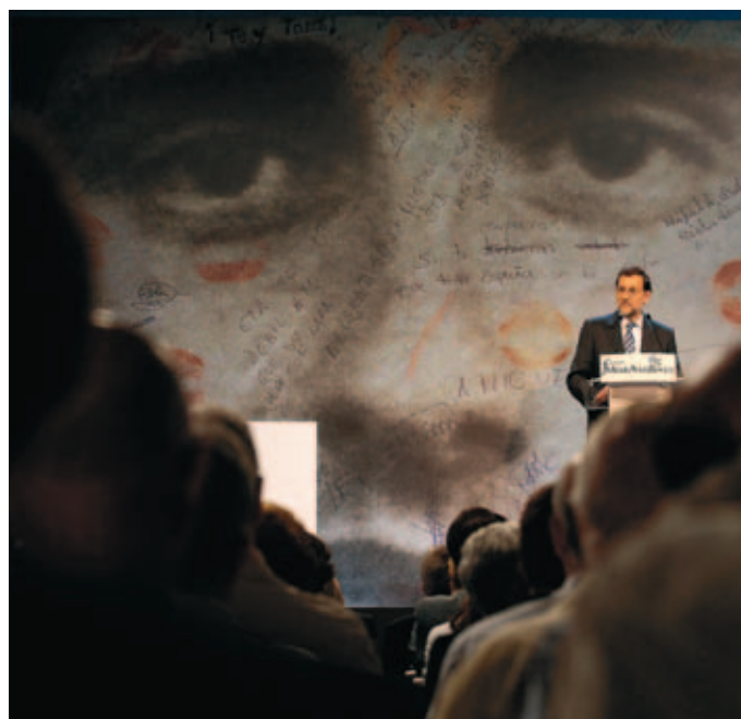
Intervención del Presidente del Gobierno.

Rajoy abogó por no perder nunca la memoria de Miguel Ángel Blanco y de todas las víctimas del terrorismo, e indicó que "la