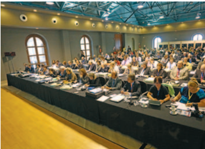
Reunión del Comité Director de CMRE.