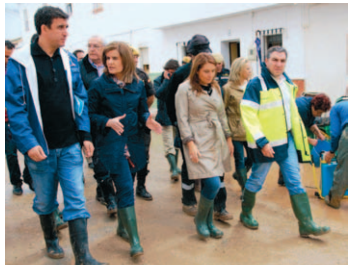
La Ministra de Empleo y Seguridad Social, Fátima Báñez, visitó algunos municipios afectados junto al Presidente de la Diputación de Málaga, Elías Bendodo (primero por la derecha).

En Andalucía Oriental, las provincias más afectadas han sido Málaga y Almería, y en menor medida Granada. En Málaga destacan los municipios de Villanueva del Rosario y Villanueva del Trabuco, la comarca de Antequera y el Valle del Guadalhorce, en especial Álora. En Almería han sufrido numerosos daños las zonas de Huércal-Overa, Vera, Cuevas de Almanzora y Pulpi ★