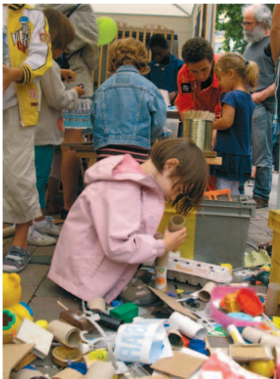
Actividades de divulgación en el Día del Cooperante.

Los cooperantes pertenecen a Entidades Locales, organizaciones no gubernamentales, organismos internacionales, misiones religiosas o representaciones de la Unión Europea, asociaciones, universidades y hospitales. El perfil medio se corresponde con el de una mujer, de entre 31 y 40 años, que desarrolla su trabajo en algún lugar del continente americano, aunque también es significativo el porcentaje de hombres (M-55% / H-45%). Por regiones, es América