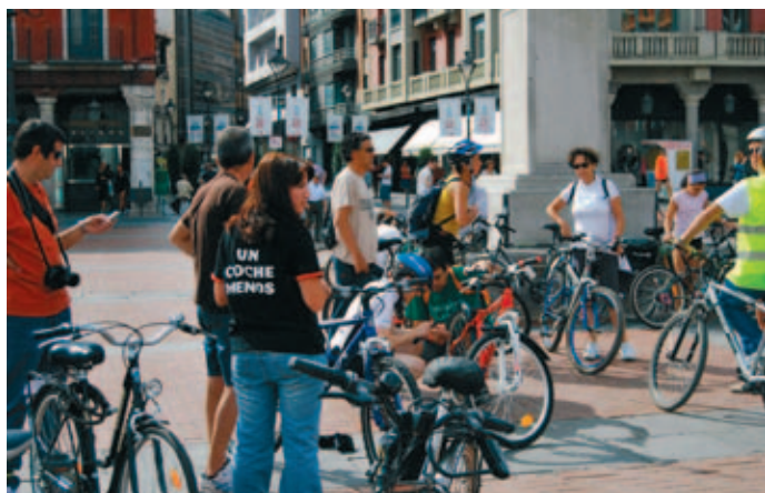
Participantes en una marcha cicloturista en Valladolid.