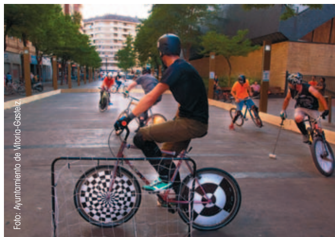
Numerosas ciudades celebraron actividades lúdicas. Aquí, un momento del partido bike-polo, celebrado en Vitoria-Gasteiz.

El representante de la FEMP afirmó que los Planes de Movilidad Urbana Sostenible (PMUS), objeto principal de promoción de la SEM, son una herramienta bastante extendida entre las ciudades españolas, de acuerdo con los resultados de un estudio específi-