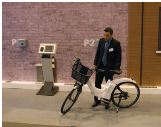
Un visitante de la última edición, en el área expositiva.

Para la presente edición MATELEC ha creado a Candela, un personaje para guiar a visitantes y participantes durante la SEE por las mejores prácticas en el uso eficiente de la energía, a partir de decálogos de consejos elaborados para el hogar, los profesionales y el sector terciario. Candela anima a compartir experiencias de ahorro y eficiencia en Twitter, @Ciudadano_20, y en facebook.com/ciudadano20.