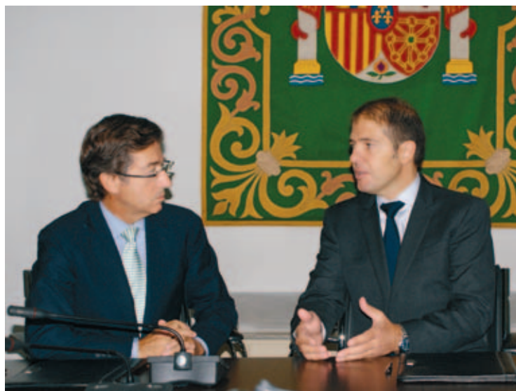
El Secretario General de la FEMP y el Director General de Ecoembes, departen en el acto de firma del convenio.

Las actividades de divulgación y comunicación que organicen ambas entidades en materia de recogida selectiva y reciclaje de envases también tendrán un protagonismo especial en este marco de colaboración. Asimismo, se promoverá la cooperación entre Ecoembes y los Entes Locales para mejorar su conocimiento sobre la generación y composición de los residuos urbanos.