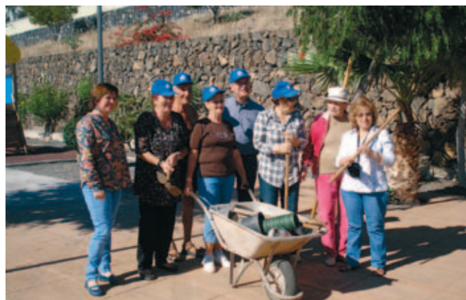
La implicación ciudadana, clave para preservar la biodiversidad. En la foto, un grupo de voluntarias del Cabildo de Tenerife.

El Secretario General de la FEMP, Ángel Fernández, alabó el compromiso de las Entidades Locales y su apuesta "firme y decidida" por incorporar en todos los ámbitos de la actuación municipal la protección de la biodiversidad y de los recursos naturales, así como la salvaguarda de los ecosistemas.