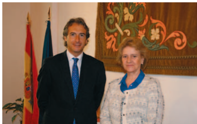
Íñigo de la Serna, con la Defensora del Pueblo.

En concreto, está prevista la firma de un convenio de colaboración con la Dirección General de Calidad y Evaluación Ambiental y Medio Natural, en octubre de 2012, uno de cuyos principales objetivos es coordinar las actuaciones en materia de prevención, evaluación y control del ruido