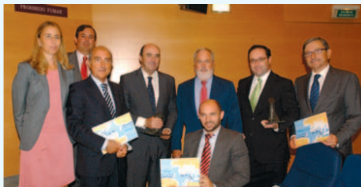
Los galardonados posan con el Ministro Miguel Arias Cañete.

Los premios fueron entregados por el Ministro de Agricultura, Alimentación y Medio Ambiente, Miguel Arias Cañete.