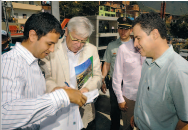
Joan Clos, con el Alcalde de Medellín (Colombia), a la derecha.

El Informe sobre el Estado de las Ciudades del mundo 2012-2013, elaborado por ONU Habitat, la agencia de Naciones Unidas para los asentamientos humanos, propone un cambio en la planificación de las ciudades del siglo XXI e incorporar variables como la equidad y la sostenibilidad, además del desarrollo económico. El informe, que sirvió de base para los debates del VI Foro Urbano Mundial, celebrado entre los días 1 y 7 de septiembre en Nápoles, invita a explorar un concepto más inclusivo de la prosperidad.