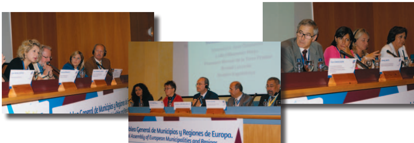
Imágenes de algunas de las sesiones celebradas en Cádiz.